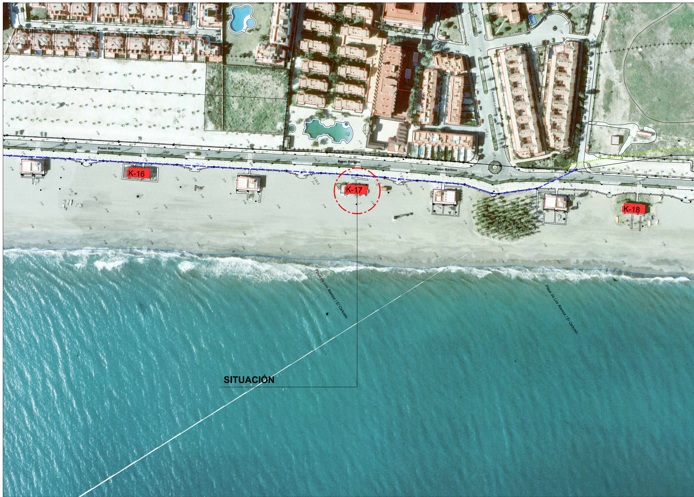
SITUACIÓN SOBRE ORTOFOTO